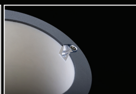
Inseri in alluminio duraturi registro perfetto