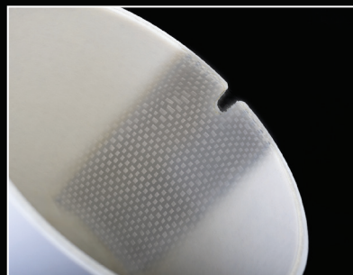
Registro duraturo e preciso grazie all'uso di fibra di carbonio