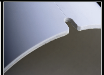
Linea guida per facilitare il taglio del nastro adesivo